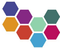
SÓKNARÁÆTLUN NORÐURLANDS VESTRA